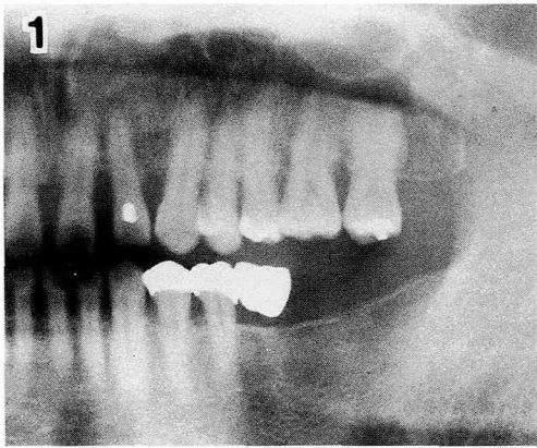
図1：初診時のパントモX線写真。

処置および経過：上記診断名のもと、同年4月23日、局所麻酔下にて上顎左側第1大臼歯を抜去した。根尖周囲には腐骨様の骨が認められたので、これをピンセットにて摘出した。しかし、上顎洞との交通はなかった。その後の経過は良好である。