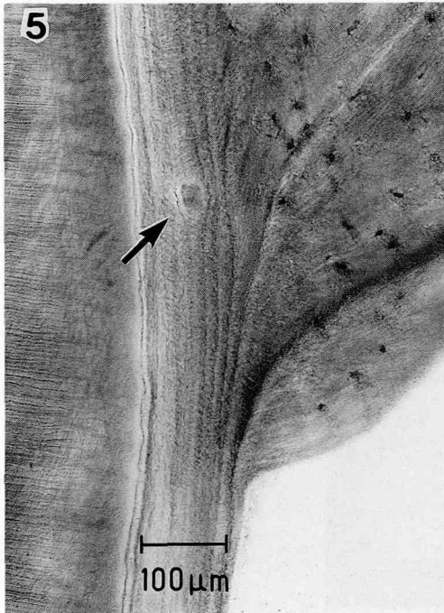
図5：増生した細胞性セメント質の拡大像。一部には介在性セメント質瘤(矢印)がみられる。(H-E, \times 120 )

本来のセメント質はセメント・エナメル境付近では約 50\mu\text{m} で，徐々にその厚みを増し最大で 120\mu\text{m} に達したが，平均的には約 100\mu\text{m} 前後の厚さであった。しかし歯根の約 \frac{1}{2} のところから，急激に細胞性セメント質の層板状添加がみられ，最大で約 2.5\text{mm} の厚さになった。同部の層板間の幅は約 100\mu\text{m} で互いにほぼ平行であるが，根尖側に向かうにつれて不規則な構造を示すように